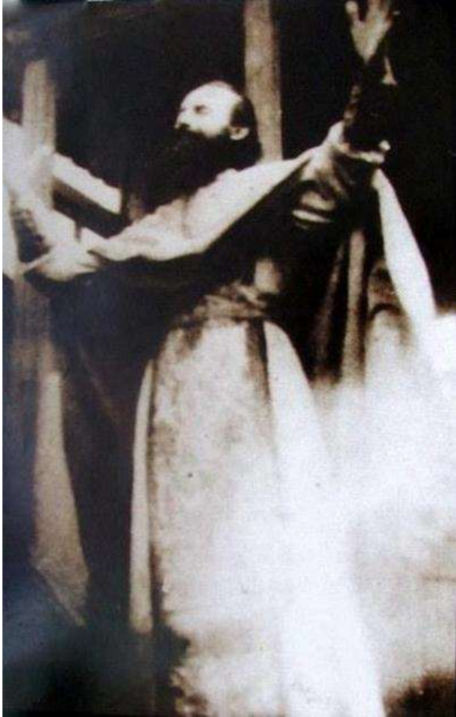
Părintele Arsenie Boca în timpul Sfintei Liturghii